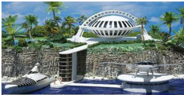
Jacques Fresco / www.thevenusproject.com

De verdad, no vale la pena seguir defendiendo un sistema con metástasis generalizada.