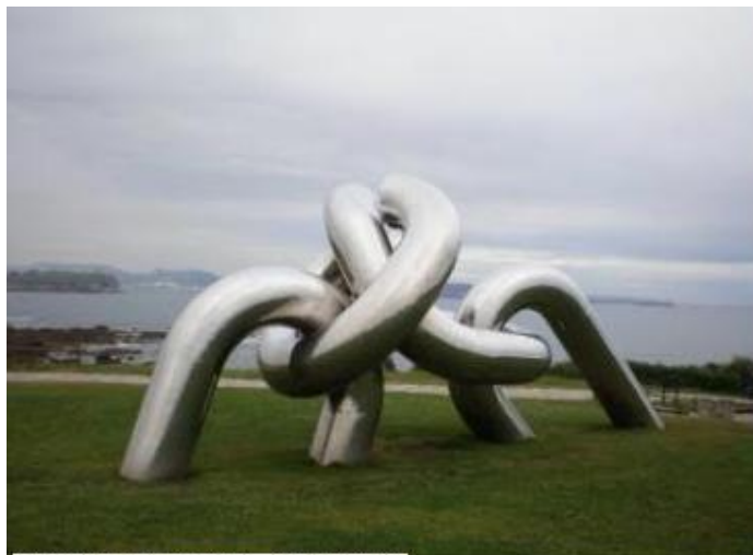
"Solidaridad" (1999) - Pepe Noja